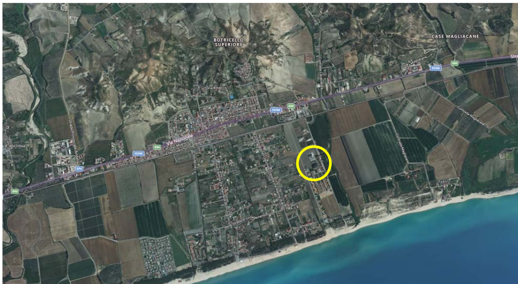
Identificazione posizione strutture nell'ambito del territorio comunale